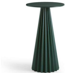
Table bistro Plissé H103