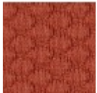
Tessuto Visual 13 Colori